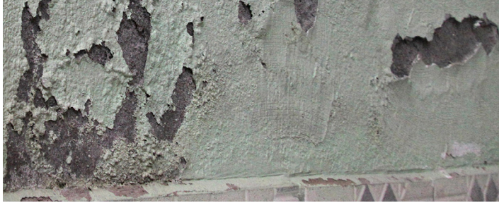
A SikaMur® rendszer használata előtt

A SIKÁ EGY TELJES TERMÉKCSALÁDOT NYÚJT A SIKERES FALSZÁRÍTÁSI MUNKÁKHOZ: